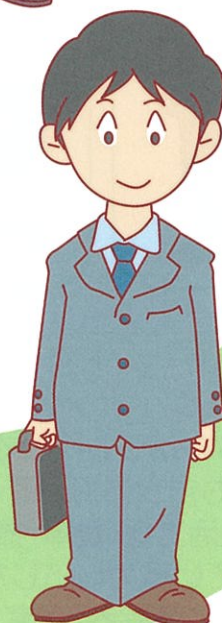
所得の低い方 (単身の求職者など)